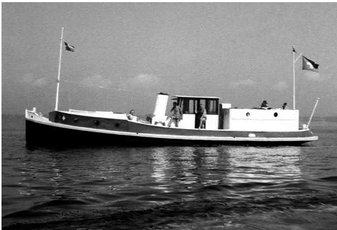
„Pour quoi pas ?“